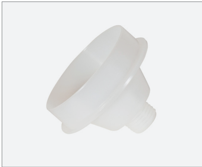
Nozzle adapter foil bags M15x1.5 Düsenadapter Folienbeutel M15x1,5

Product code / Artikelnr. 0001-4900-4001