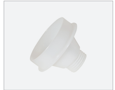
Nozzle adapter foil bags M22x2 Düsenadapter Folienbeutel M22x2

Product code / Artikelnr. 0001-4900-4003