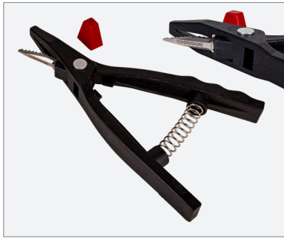
Nozzle pliers for V-cutouts Düsenzange für V-Ausschnitte