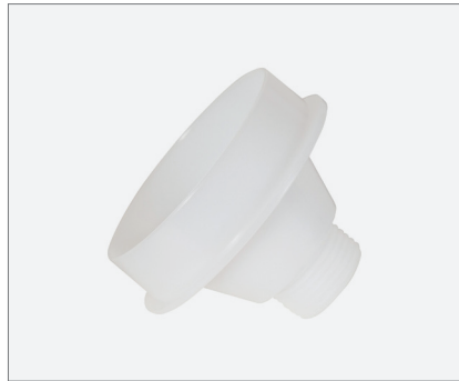
Nozzle adapter foil bags M20x1.5 Düsenadapter Folienbeutel M20x1,5

Product code / Artikelnr. 0001-4900-4002