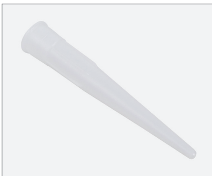
Cartridge tip with thread M15x1.5 Kartuschenspitze mit Gewinde M15x1,5

Product code / Artikelnr. 0001-4900-2000