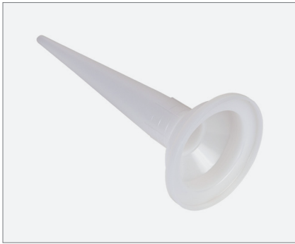
Nozzle for foil bags and dispensers Düse für Folienbeutel und Auspressgeräte