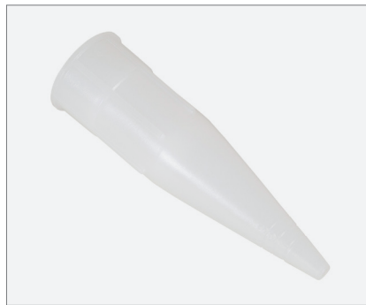
Nozzle tip with thread M20x1.5 Düsen-Spitze mit Gewinde M20x1,5

Product code / Artikelnr. 0001-4900-2005