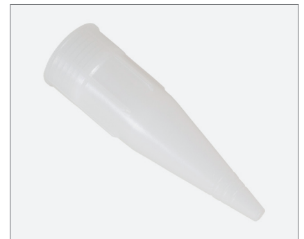
Nozzle tip with thread M22x2 Düsen-Spitze mit Gewinde M22x2

Product code / Artikelnr. 0001-4900-2004